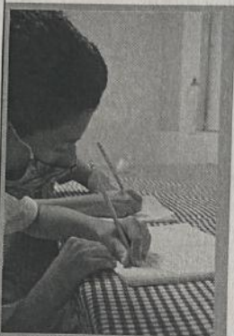
Estudiantes de Arte