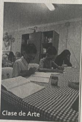
Clase de Arte