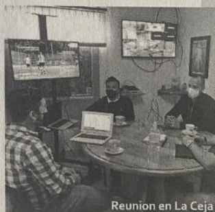
Reunión en La Ceja